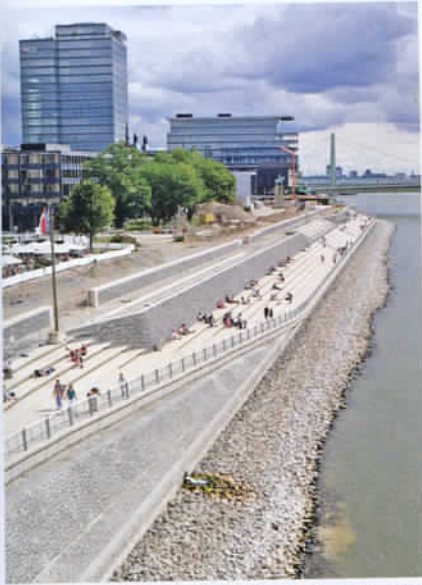
Kostenexplosion beim Kölner Rheinboulevard. Die Stadt bleibt auf Mehrkosten sitzen.

Boulevards mit großformatigen Betonplatten zu pflastern. „Die Vorteile der größeren Formate liegen darin, dass sie großzügiger wirken und den Fertigteilen der Ufertreppe optisch und in der höheren Fertigteil-Qualität angepasst sind“, so die Stadt 2014. Und diese Entscheidung stellte wiederum neue Anforderungen an die Ausführung des Unterbaus. Mehrkosten von 485.000 Euro waren die Folge.